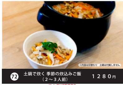
72 土鍋で炊く季節の炊込みご飯 (2~3人前) 1280円 Woltでは非販売商品