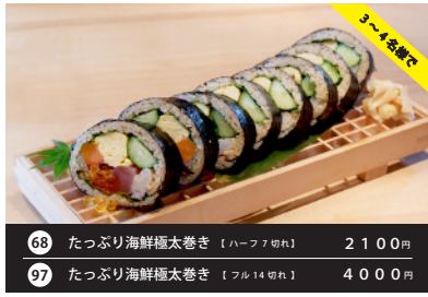
スピードメニュー 68 たっぷり海鮮極太巻き 【ハーフ7切れ】 2100円 97 たっぷり海鮮極太巻き 【フル14切れ】 4000円 Woltでは非販売商品