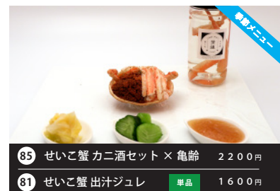
新メニュー 85 せいこ蟹 カニ酒セット × 亀齢 2200円 81 せいこ蟹 出汁ジュレ 単品 1600円 入荷不定期、ご予約されていても当日お届けが困難な場合がございます。