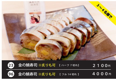
スピードメニュー 23 金の鯖寿司 ※炙りも可 【ハーフ7切れ】 2100円 96 金の鯖寿司 ※炙りも可 【フル14切れ】 4000円 Woltではフル14切れのみの販売