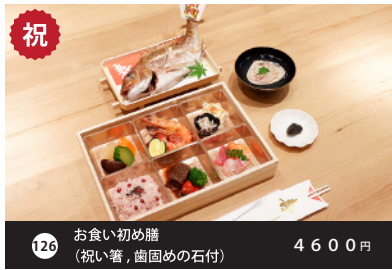
祝 126 お食い初め膳 (祝い箸, 歯固めの石付) 4600円 Woltでは非販売商品