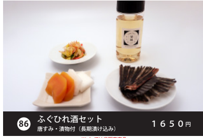
86 ふくひれ酒セット 1650円 唐すみ・漬物付 (長期漬け込み) Woltでは非販売商品

UbarEats/Woltでは非販売商品 弁当販売: 白島調整 酒類販売: 株式会社パートナー (調整酒販部)