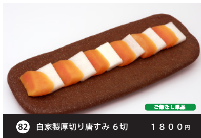
82 自家製厚切り唐すみ6切 1800円 ご飯なし単品 Woltでは非販売商品