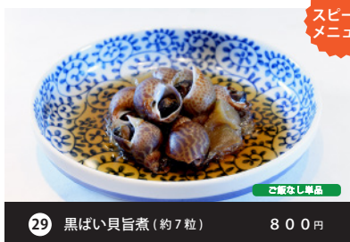
スピードメニュー 29 黒ばい貝旨煮 (約7粒) 800円 ご飯なし単品