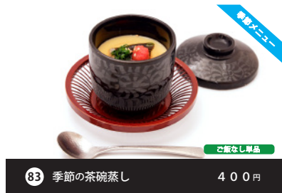
新メニュー 83 季節の茶碗蒸し 400円 ご飯なし単品 Woltでは非販売商品