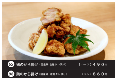
65 鶏のから揚げ (国産鶏 塩麴タレ漬け) 【ハーフ】490円 98 鶏のから揚げ (国産鶏 塩麴タレ漬け) 【フル】860円 Woltではフルのみの販売