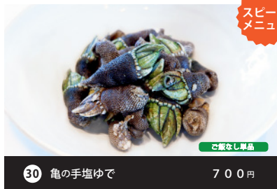
スピードメニュー 30 亀の手塩ゆで 700円 ご飯なし単品