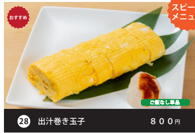
おすすめ 28 出汁巻き玉子 800円 ご飯なし単品