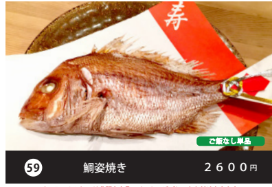
59 鯛姿焼き 2600円 ご飯なし単品 UbarEats/Woltでは非販売商品 メッセージプレートお付け出来ます