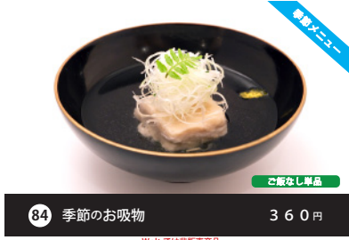
新メニュー 84 季節のお吸物 360円 ご飯なし単品 Woltでは非販売商品